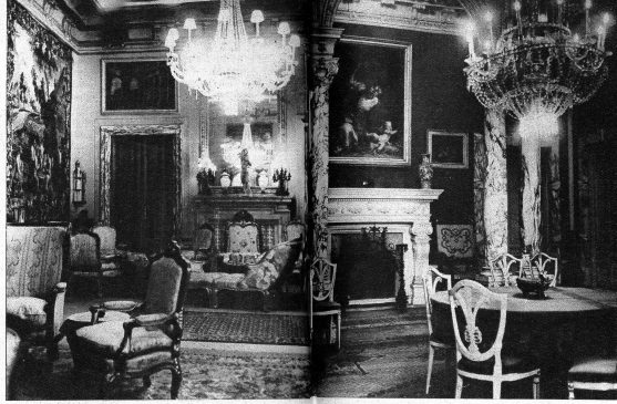
Prunkvoller Salon mit Stilmöbeln, kostbaren Gemälden und Gobelins im Hochparterre