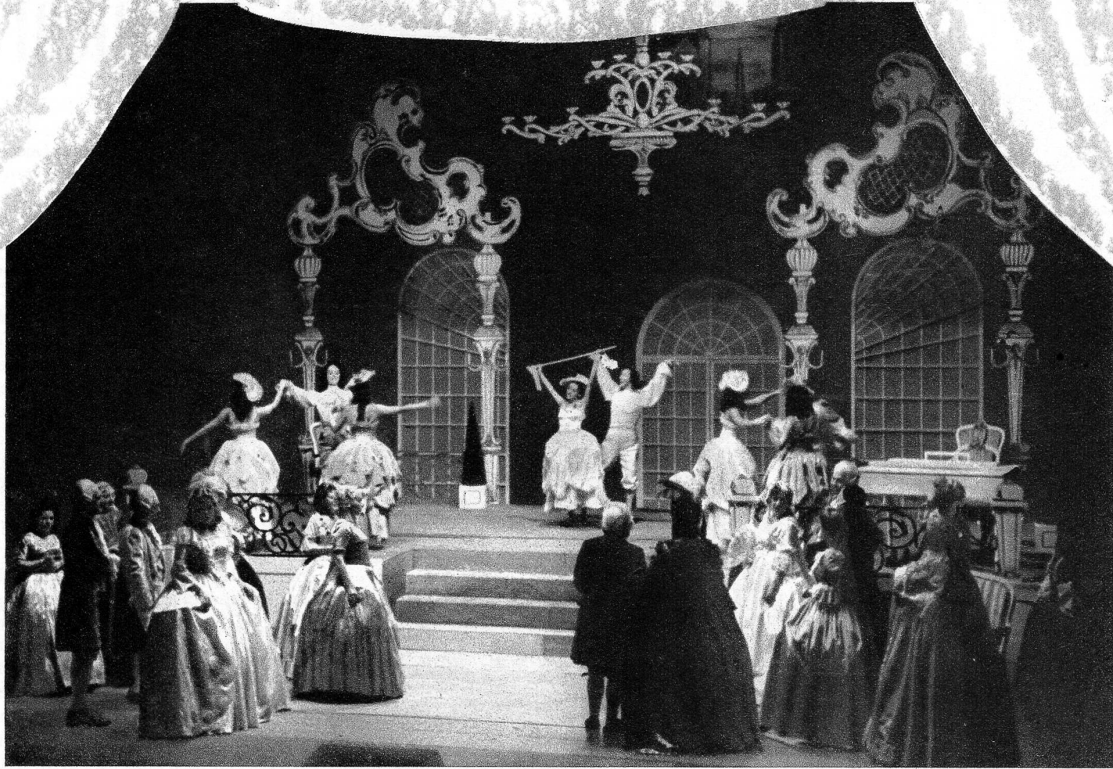
Was wäre ein Bühnenbild ohne Kostüme?

ts. Eines Abends sind sie da, auf der Theaterbühne nämlich, samt «Inhalt», und der Zuschauer nimmt von dieser Tatsache mit — Selbstverständlichkeit Kenntnis. Er weiss, dass zum «Theatern» nun einmal die Kostümierung gehört, gemäss dem Sprichwort: «Kleider machen Leute».