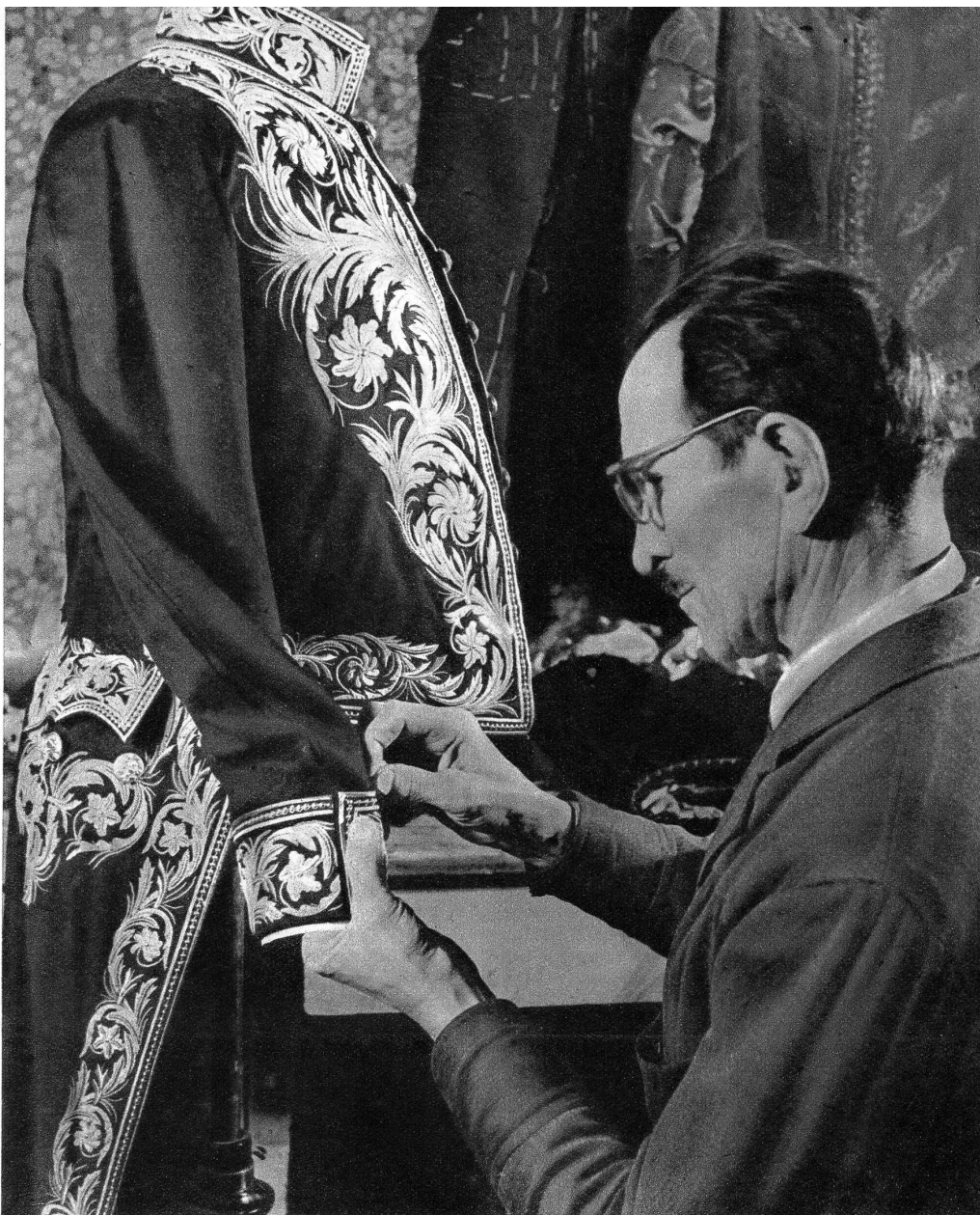
Diese Diplomatenuniform ist das Geschenk eines ehemaligen holländischen Gesandten in der Schweiz. Die Stickerei aus purem Gold allein repräsentiert einen Wert von über 2000 Franken.

Es ist praktisch unmöglich, für jedes zur Aufführung kommende Bühnenstück die hiezu notwendigen Kostüme der Garderobe zu entnehmen. Während die klassischen Opern, Operetten und Schauspiele ihre Roben und Gewänder längst auf Lager haben, erfordern Neueinstudierungen moderner Bühnenwerke in der Regel auch die Anfertigung neuer Kostüme. Hier nun hat die