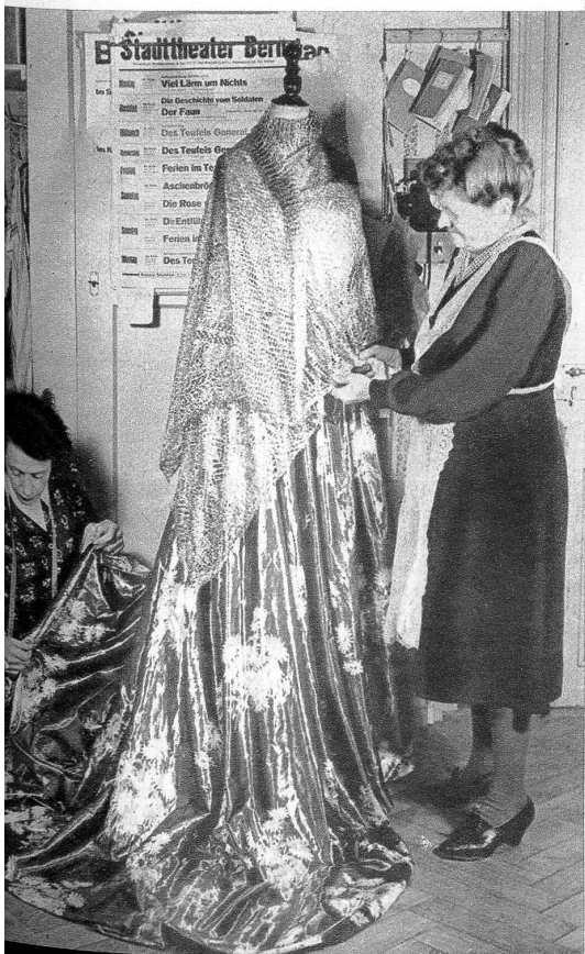
Das prachtvolle und sehr wertvolle Brokatkleid aus Goethes «Natürliche Tochter»

In dieser Art und Weise fallen die Kleider im Theater vom Himmel, vom Publikum oft bewundert und bestaunt. Einmal aber haben wir versucht, den Wolkenvorhang und die Himmelstüre vor den Augen des Theaterbesuchers zu öffnen, um jene geduldigen «Engel» zu zeigen, die im stillen so viel des Farbenreichen und Formenschönen schaffen. Unser nächster rauschender Beifall im Zuschauerhaus soll zur Abwechslung einmal auch ihnen gelten.