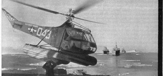
Links: Die Wal-Bay, seawärts, von einem Helicopter-Flugzeug aus gesehen. Die Einfahrt ist 380 Meter breit; sie hat sich seit der letzten Expedition im Jahre 1958 um rund 3 Kilometer verengt, und zwar durch das von beiden Seiten vorstossende Eis, das eine Dicke von 18 Metern aufweist.