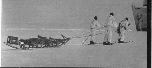
Rechts: Während das Flaggschiff «Mount Olympus» durch Packeis gezwungen war, für einige Tage liegen zu bleiben, machte sich die Besatzung zur Seehundsgagd auf. Wir sehen hier vier Mann, einen 500pfündigen Seehund nach sich ziehend, zum Schiff zurückkehren.