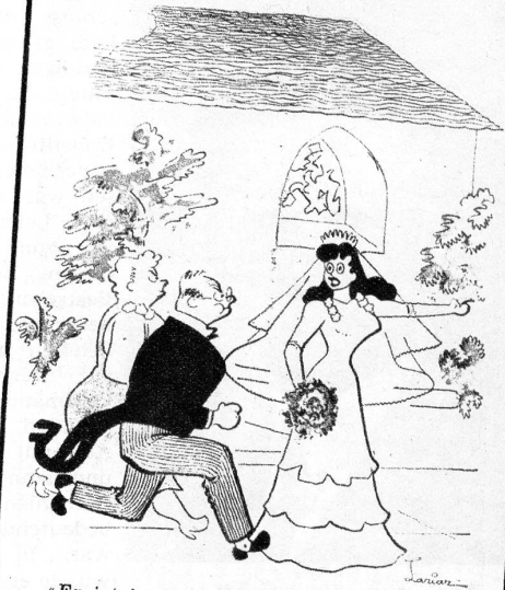
«Er ist in dieser Richtung gelaufen!» (Esquires)