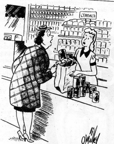
«Was — ich kann haben soviel ich will? Dann nehm' ich nur eine!» (Christian Science Monitor)