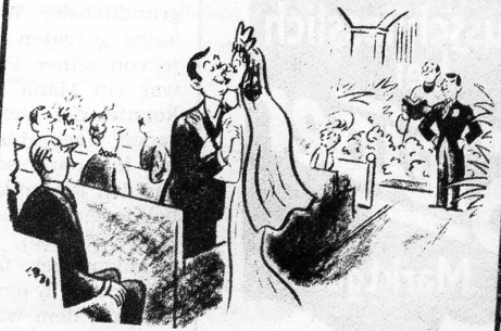
«Ach, Jonny, wie nett, dass du...»

Senkrecht: 1. Gleich wie 1 waagrecht. 2. Lehrbuch. 3. Schluss. 4. Lebhaft. 5. Tätigkeit. 6. Gesetzbuch, abgek. 8. Nagetier. 10. Textilien. 15. Teil. 16. Religiöse Handlung vornehmend. 19. Einbringen. 20. Mädchenname. 22. Baumart. 23. Zeitbegriff. 25. Augensterne. 26. Bundesrat. 29. Fragend (örtlich). 31. Chem. Zeichen eines Elementes.