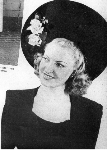
Grosser aufgeschlagener Feltstut mit Rosengarnitur

Viel Blumen und Spitzen finden Verwendung und gehen der neuen Mode einen luxuriösen Aspekt. Wenn diese in ihren extremen Tendenzen, sie erinnert vielfach an Modelle aus den Jahren 1900, auch nicht durchwegs unserem ungeteilten Beifall finden mag, so wird sie doch mit der Betonung der weichern und fraulicheren Linie vielfach Beifall finden. hr.