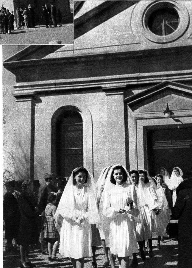
Links: Der Herr Pfarrer im Gespräch mit zwei Konfirmandinnen. — Rechts: Nach der Konfirmation: Die Konfirmandinnen verlassen die Kirche

An der Strasse nach Echallens, tief im Waadtland, liegt das Dörfchen Prilly. Am Palmsonntag und Ostersonntag sieht man hier junge Mädchen mit weissem Schleier und meistens weissen Kleidern, die ihnen ein wenig den Ausdruck trauernder Bräute geben, zur Kirche gehen. Heute ist ihr Konfirmationstag; es ist ihr grosser Tag, denn sie werden gefeiert und auch beschenkt. In ihren neuen Kleidern und mit den weissen Schleiern gehen sie, mit einer leichten Unbeholfenheit, ins Gotteshaus. Wie ein Senkblei legt der