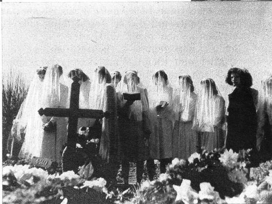
Hier in Prilly lebt der schöne Brauch, dass die Konfirmandinnen nach der Konfirmation auf den Friedhof gehen, um dort der jungen Verstorbenen zu gedenken

«Ich bin ganz Ihrer Meinung. — Oben — er zeigte auf den verhüllten Gipfel — «da liegt fusshoch Schnee, weiter unten handbreit