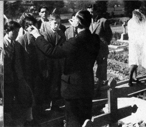
Gesang zu Ehren der jungen Verstorbenen