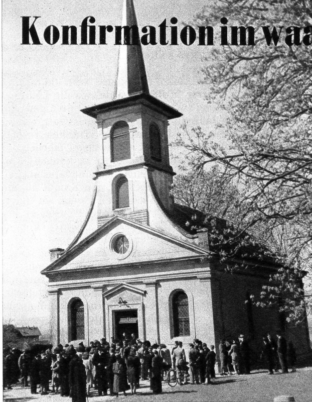
Am Palmsonntag läuten in Prilly die Glocken zur Konfirmation

Herr Pfarrer in die vielleicht seltsam bewegte Seele eine religiöse Ermahnung. Er redet von Pflicht und von Verantwortung und gibt ihnen Kraft aus dem Geist des Herrn auf ihren Lebensweg.