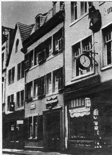
Strassenansicht von Beethovens Geburtshaus in Bonn, das als Beethoven-Museum eingerichtet wurde

Holland und als 11- und 12jähriger gibt er bereits die ersten Klaviervariationen heraus. Die letzten Unterrichtsweihen soll der begabte Knabe beim grössten lebenden Meister, bei Mozart, erhalten und 1787 reist er mit Unterstützung des kurkölnischen Hofes nach Wien, muss aber wegen der Mutter Tod sein Studium unterbrechen und kann erst 1792 wieder nach Wien zurückkehren. Nun ist aber nicht mehr Mozart, sondern Josef Haydn sein Lehrmeister. Dann erwirbt sich Beethoven als Klavierspieler grossen Ruf, hinzu aber steht er binnen weniger Jahre in der ersten Reihe der schaffenden Musiker, und im März 1795 ist der Meister als Spieler eines eigenen Klavierkonzertes in Wien öffentlich aufgetreten. Nun beginnen Konzertreisen durch