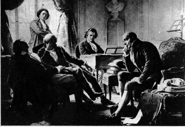
Beethoven im Kreis seiner Freunde Gemälde von A. Gräffe