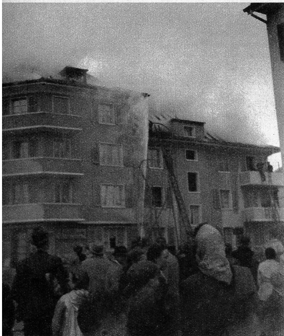
Am Mittwoch der vergangenen Woche brach im Estrich eines Mehrfamilienhauses in Wabersacker bei Köniz Feuer aus, dem der ganze Dachstock des Hauses zum Opfer fiel. Nach zwei Stunden konnte der Brand durch die Feuerwehr gemeistert werden, doch entstand durch das Wasser erheblicher Schaden im ganzen Hause