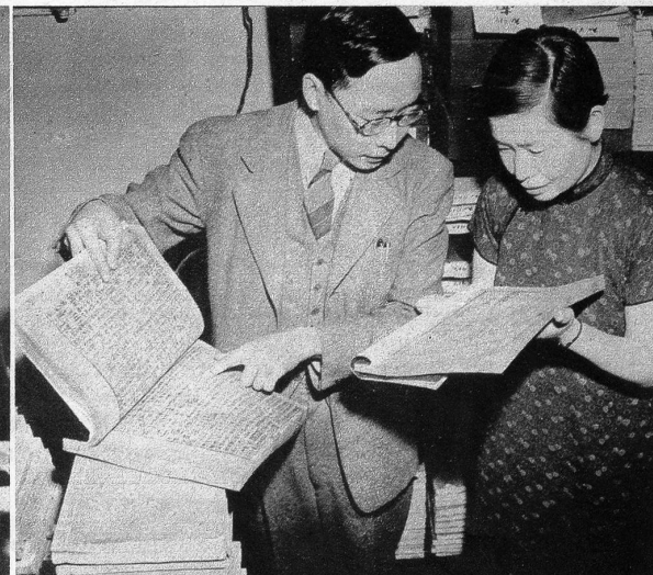
Bücher aus der ganzen Welt kann man in diesen fahrenden Bibliotheken finden, und auf dem Bilde sieht man ein chinesisches Ehepaar beim Betrachten von alten chinesischen Büchern