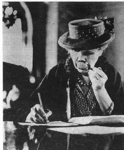
Auch für die alte Dame sind die fahrenden Bibliotheken eine gute Sache, hat sie doch ein Buch gefunden, das ihr ganzes Interesse in Anspruch nimmt