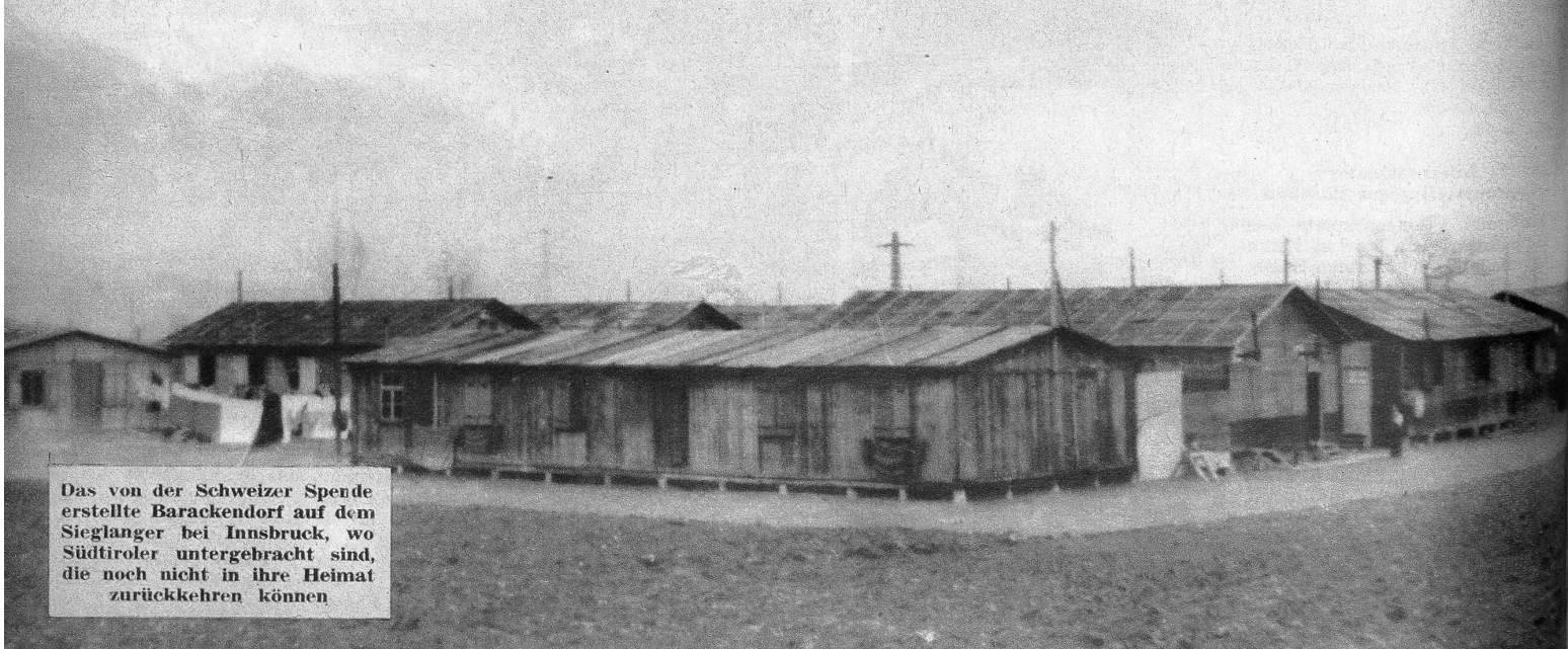
Das von der Schweizer Spende erstellte Barackendorf auf dem Sieglanger bei Innsbruck, wo Südtiroler untergebracht sind, die noch nicht in ihre Heimat zurückkehren können