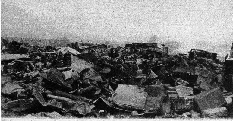
Auf dem Weg zum Südtiroler Dorf zwischen Innsbruck und dem Sieglanger kommt man an einem hunderte von Metern langen Trümmerfeld vorbei, wo die Wracks der im Krieg zusammengeschnittenen Flugzeuge und Motorfahrzeuge zusammengetragen sind