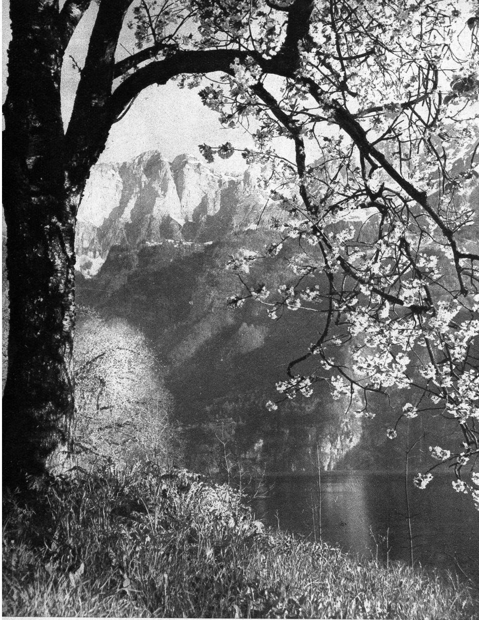
Frühling am Wallensee