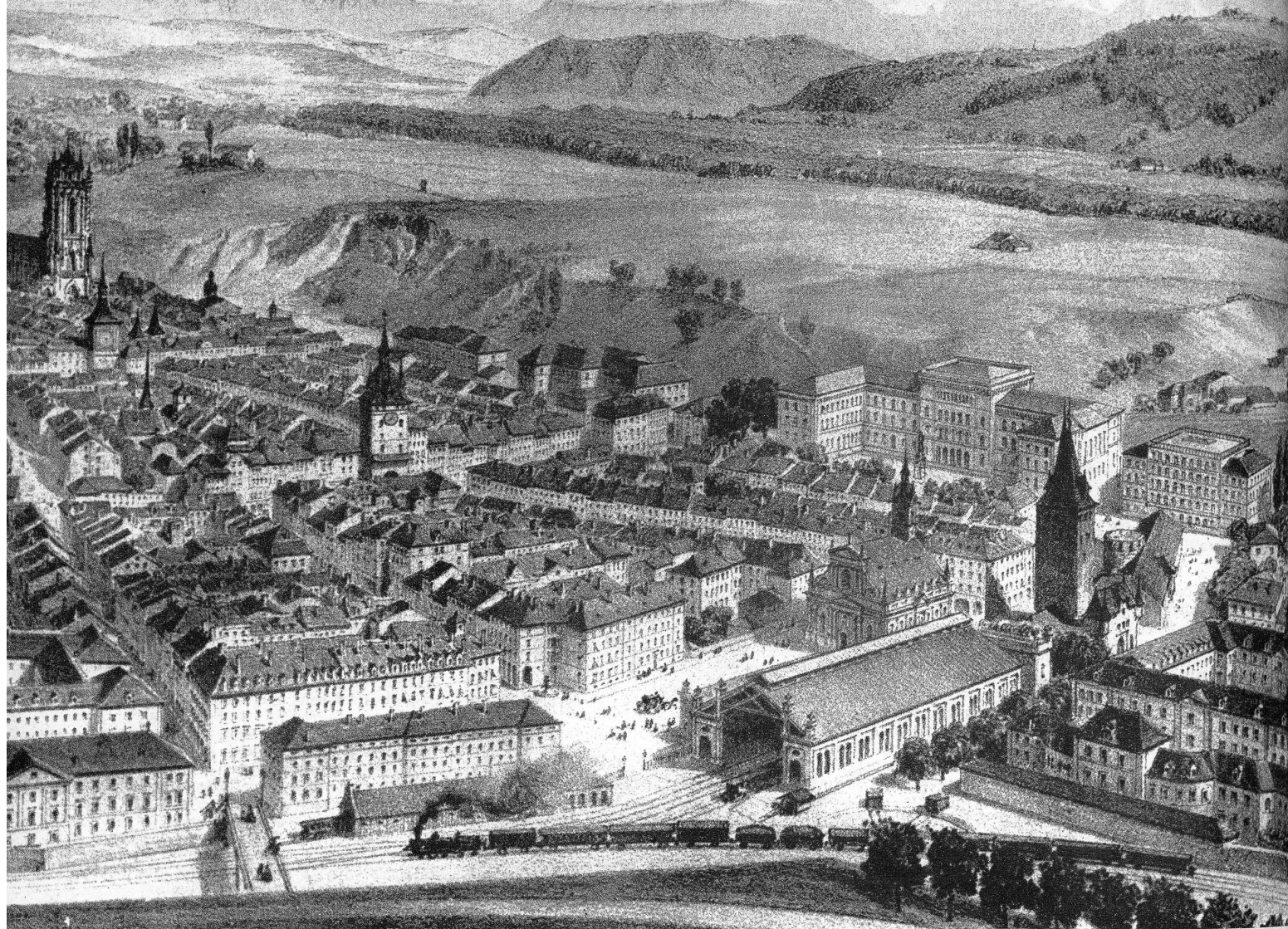
Blick auf das Bollwerk und den Bahnhofplatz kurz nach dem Bau der ersten Eisenbahnlinie. Noch steht rechts der Christoffelturm, das ehemals schöne Eingangstor zu unserer Stadt