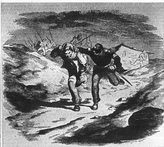
Royalistische Agenten werden verfolgt und gefangengenommen