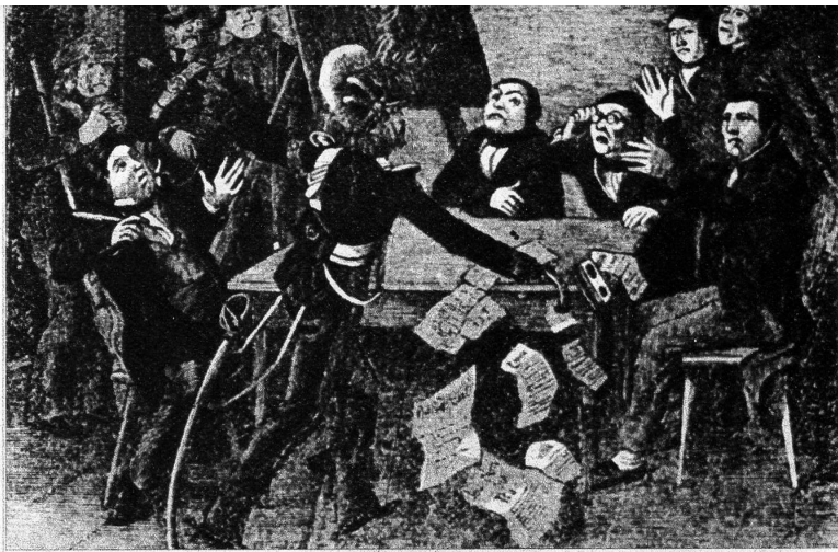
Im Jahre 1856 wurden die royalistischen Gesellschaftshäuser geschlossen, die verdächtigen Royalisten abgefa-

Der Bundesrat versäumte auch nicht für allfällige ernstere Ereignisse die nötigen militärischen Vorbereitungen zu treffen. Denn wie gross die Empfindlichkeit der Diplomatie ist, wenn ihr Wille nicht sofort erfüllt wird, zeigte Preussen, das durch die Note vom 16. Dezember 1856 die Beziehungen mit der Schweiz als abgebrochen erklärte. Preussen glaubte durch diesen diplomatischen Bruch die Schweiz einzuschüchtern, aber umsonst. Die Schweiz mobilisierte und stellte das Heer unter den Oberbefehl von General Dufour. Preussen wagte doch nicht eine militärische Aktion zu ergreifen, so dass der Ausgang des verhängnisvollen Kampfes zwischen Republik und Monarchie im Kanton Neuenburg im Mai 1857 zugunsten der Schweiz ausfiel.