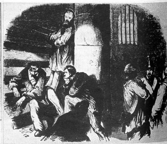
Die gefangenen Royalisten in der Kollegiatkirche