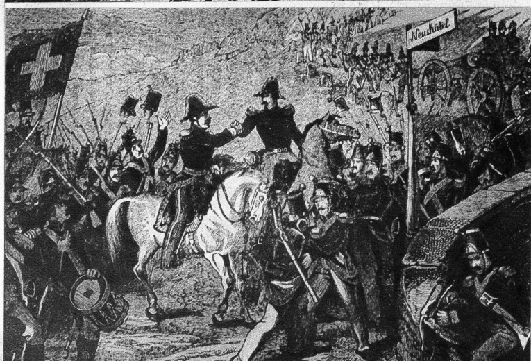
Die Vereinigung der republikanischen Kolonnen Oberst Denzlers mit Major Girards Truppe und Marsch nach Peseux und Neuchâtel