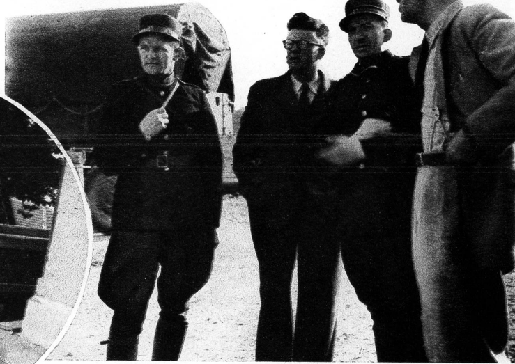
Das wäre die Herre, wo däm Transport dr Wäg bahnet hei

E Brunne hei sie z'Bälp o no überschosse