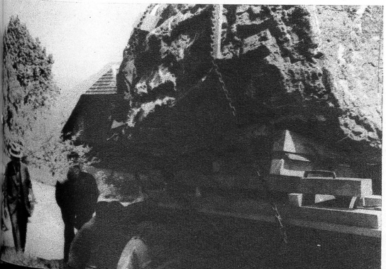
Pneuwächsel, es bsundrigs Vergnüege