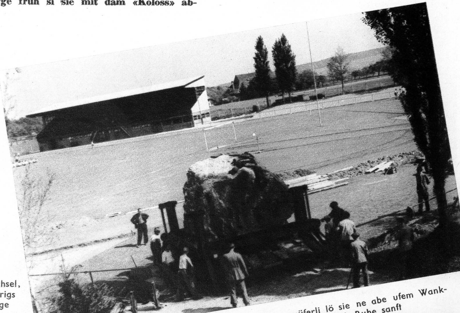
üferli lö sie ne abe ufem Wank- rube sanft

gfahe. Aber es het no allerhand z'brichte und z'dänke gä, bis mene du z'Bärn inne gha het. Da het er afe z'Bälp am Stutz obe um z'Tausig Gotts Wille nid ume Rank wölle, so dass sie du ga Riggisbärg ufe hei müesse ga chehre. D'Bälper hei allerlei gseit u dänkt. Fasch het es se gfreut, dass är ne so viel z'achaffe gmacht het. Vom Brieffreger bis zum Gemeinspresidant isch alls da gsi, um dä Stei no es Rüngli z'begleite. Wo sie gäge Riggisbärg ufe cho si, hets scho wieder ghaeret. Dene Pneu hets afa warm mache un ufs Mal hets Plattfüess gä. Es Velo git scho alleini gnuet z'flicke, aber we de no 38 000 kg uf somene Wägeli obe si, de cha me sech ja sy Sach dänke. No drümal hets ufem Wäg ga Bärn ine Plattfüess u Flicke gä. Ersch z'Nacht am halbi zwölfi si sie du ändlige ufem Wankdorf usse aho. D'Bärner hei vo der nächtliche Fahrt nid viel gmerkt, drum dörfe sie de am Eidg. Turnfescht dä Stei ga aluege u sech dänke, was da het müesse gschaffet wärde, bis er da usse isch gsi.