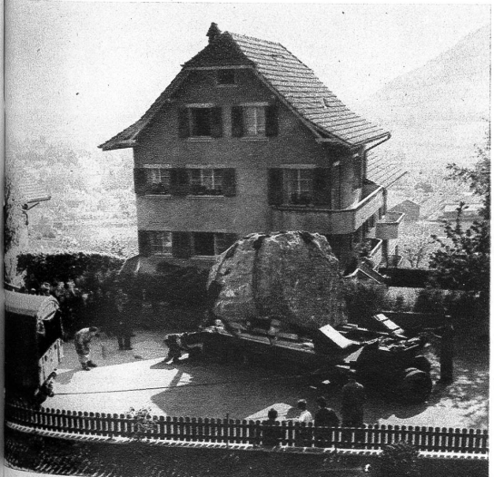
Ume Rank het «är» nid wölle, es het alls manöveriere u chüderle nüd abtreit