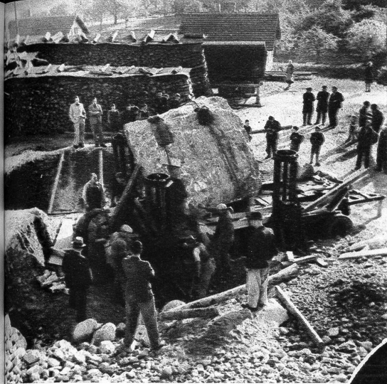
Aendlige hei sie ne dobe ufem Wage