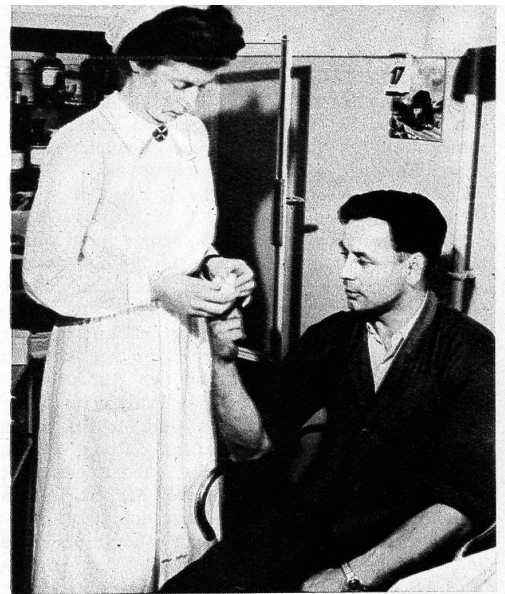
Gleich gereinigt und kunstvoll verbunden heilen die Wunden der Arbeit rascher, wenn sie auch auf den ersten Blick noch so böse aussehen mögen

„Ausgezeichnet. Die Arbeit ist hier selbständiger und verantwortungreicher als in den grossen Spitalbetrieben, zudem ist der Vorteil der regelmässigen Arbeitszeit nicht zu unterschätzen. Seit drei Jahren bin ich hier und kenne die Leute, wie sie mich kennen, so dass das gegenseitige Vertrauen da ist, das die Grundlage für gutes Zusammenarbeiten schafft.“