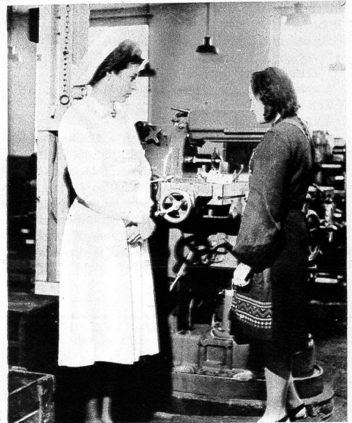
Man braucht gar nicht krank zu sein oder Unfall zu haben, und doch wäre man froh, die Schwester dies oder das zu fragen. Darum macht sie täglich einen Rundgang durch die Abteilungen des Werkes