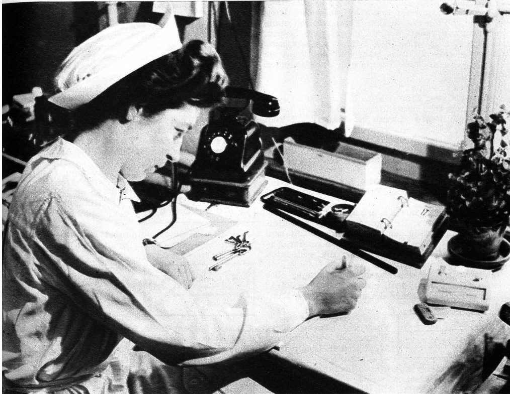
Die Anzahl der täglichen Hilfeleistungen ergibt bis zum Feierabend eine ganz ordentliche Liste

Da stehen wir also vor einer Tür mit der Aufschrift „Sanität“ und drücken auf die Anmeldungstaste. Es erscheint die Leuchtschrift „eintreten“ und gleich darauf stehen wir in einem sauberen hellen Behandlungszimmer. Draussen der Maschinenlärm von Dutzenden von Stanzen, Fräsen und Pressen, hier drinnen wohlthuende Ruhe. Hier ist der Arbeitsplatz der Fabrikschwester: „Was haben Sie eigentlich für Aufgaben?“ „In einer grossen Fabrik mit so vielen Leuten gibt es immer irgendwelche Unfälle, die sofortige Behandlung nötig machen. Natürlich hat jeder Betrieb seine Verbandkiste und grössere Unternehmungen richten auch Sanitätszimmer, wie dieses, ein. Hier ist aber die Leitung über das gewöhnliche Mass der Vorkkehrungen noch hinausgegangen, und ich bin dazu da, um bei den Unfällen des Alltags meine Berufskennntnisse anzuwenden.“