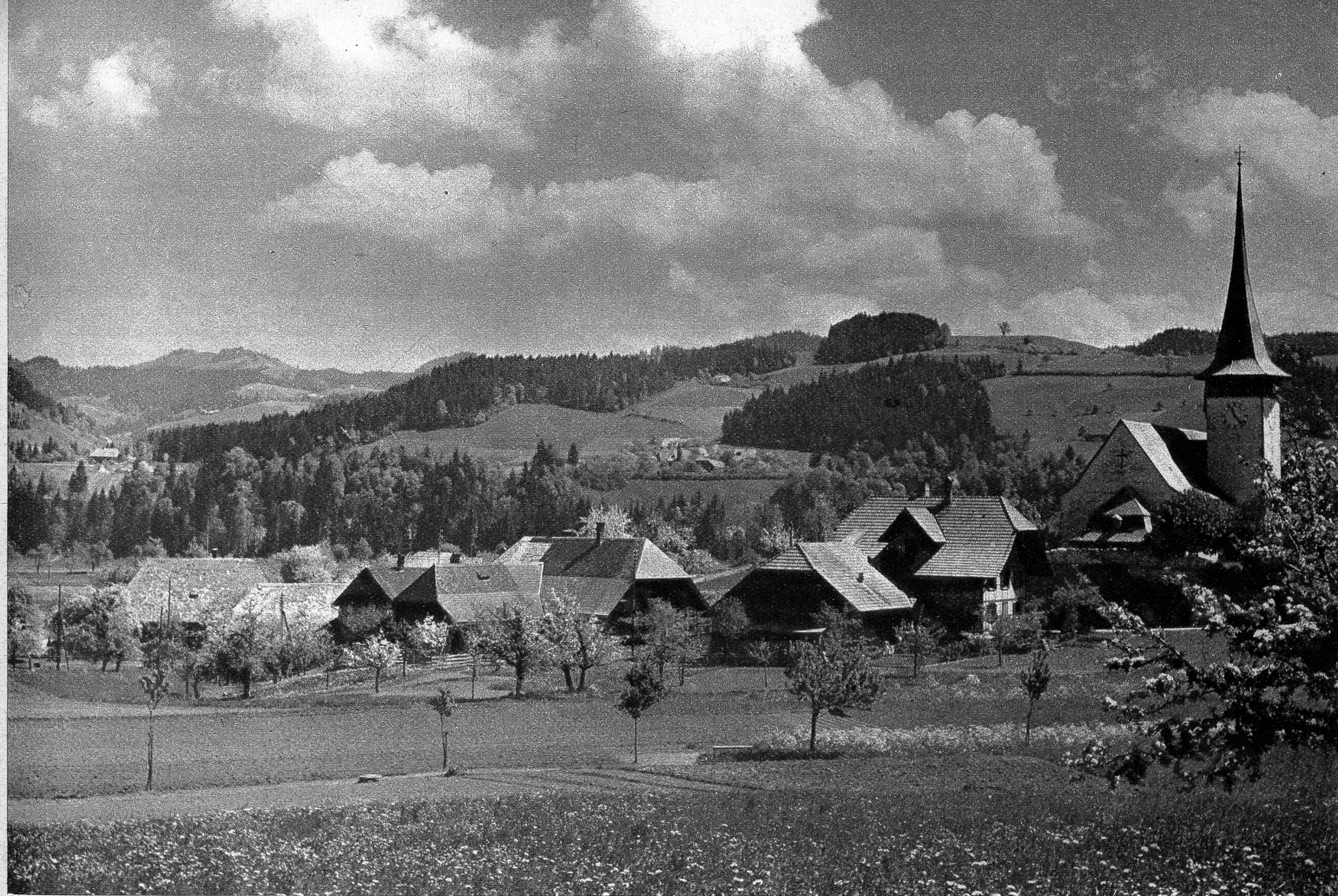
Lauperswil im Emmental