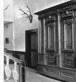
Ein schöner, alter Renaissanceschrank ziert die Eingangshalle