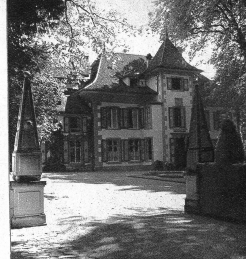
Der Eingang zum Schloß ist auf der nordwestlichen Seite

Im Winter musste der Wirt an den Gerichtstagen zwei Stuben heizen, damit «das Gricht röwig seye». Die Gerichtsmannen mussten allerdings ungestört liegen können, um Streitthändel