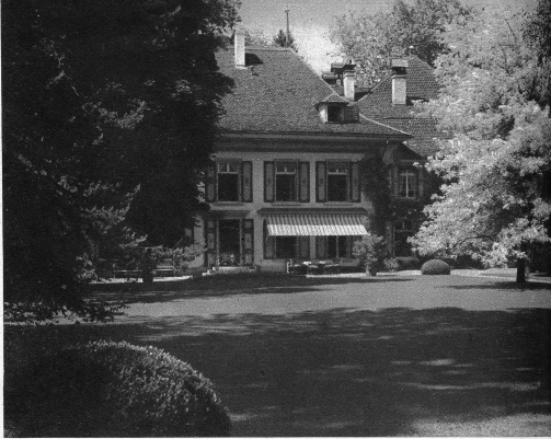
Schloss Kiesen steht in einem wunderschönen Park mit altem Baumbestand. Hier sehen wir die Oeffnong des Schlosses

Von 1800 bis 1813 war er Oberamtmann von Koenigen. Dieser Amtsbezirk hatte anfänglich noch keinen Amtssitz (Schlosswil) wurde erst 1811 Staatsigentum, und Kiesen war daher während Effingers Amtszeit Bezirkshauptort. Die Käserlei zu Kiesen, die erste bernische Talkäserei, gründete Effinger 1815. Im folgenden Jahre wurde er Mitglied der Regierung; aber 1821 übernahm er