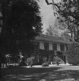
Ein Seitenflügel des Schlosses, das in seiner ganzen Ausdehnung sehr gross ist