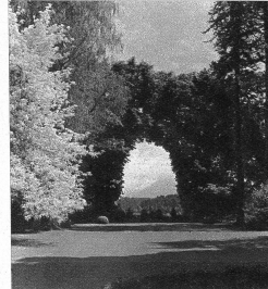
Partie aus dem Park mit Blick gegen Niesen