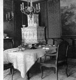
Das Esszimmer behertert als besonderen Schmuck einen schönen, alten Ofen