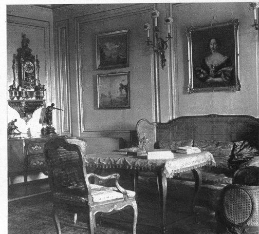
Unten: Partie aus dem Salon mit schönen Louis-XV-Möbeln