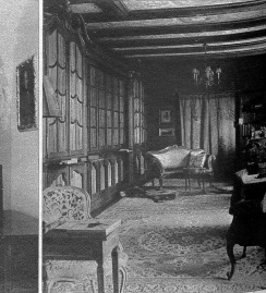
Von der Bibliothek aus geniesst man eine wunderbare Sicht auf die Alpen

zu schlichten, Verträge zu fertigen, die Aufnahme von Darlehen gegen Grundpfand zu gestatten, Beteiligungen zu bewilligen, Vormundschaftsachen zu erledigen und — allerhand kleine Sünden zu bestrafen. (Die üblichen Verfehlungen waren etwa Schelhändel und Waldfrevel.)