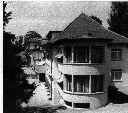
Das Spital. Der neu angebaute Flügel für Tuberkulosekranke

Wohl ist das Emmental nicht reich an geschichtlichen Ereignissen. Es ist zu abgesehen, als dass die Welthändler ihre Wellen bis in die stillen Täler des Hügel- und Berglandes zu werfen vermochten. Und doch hat auch das Emmental seine Geschichte, wenn sie auch nicht mit Blut geschrieben ist. Ein Abesitz auf einem seiner