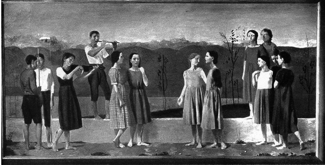
Wandgemälde im Singsaal des Mädchensekundarschulhauses Laubegg von Walter Clénin, 1922 ausgeführt