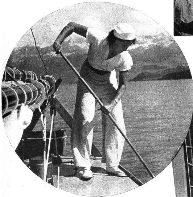
Auch die Reinhaltung der Boote gehört zu den Arbeiten der Segelmannschaft

W asser und Sonne sind zwei Begriffe, die auf uns Menschen von jeher eine grosse Anziehungskraft ausgeübt haben und immer wieder locken, sich während den schönen Sommermonaten am See aufzuhalten, um dem einen oder andern Wassersport zu fröhnen. Wenn es noch recht kühl ist, und der See nicht zum Bade lockt, dann sieht man bereits die ersten Segelschiffe über die weite Fläche gleiten, und je mehr der Sommer seinem Höhepunkt entgegengeht, um so zahlreicher werden die kühn durch die Wellen gesteuerten Jachten. Das Segeln gehört zu jenen Sportarten, die zwar nicht übermässige körperliche Anstrengungen verlangen, die aber volle Aufmerksamkeit beanspruchen. Je nach der Windstärke ändert sich die Taktik, und wer die Kunst des Segelns nicht gründlich versteht, kann unliebsame Ueberraschungen erleben. Doch die Fahrt in Luft und Sonne stärkt die Lebensgeister und schafft gesundheitliche Reserven für einen langen Winter, während dem man von den vielfachen Erinnerungen eines schönen Sommersportes zehrt.