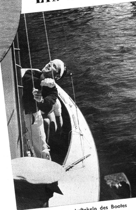
Beim Auftakeln des Bootes