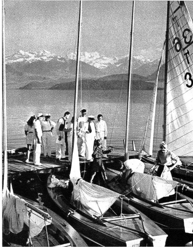
Rendez-vous am Startplatz in Hilterfingen

W asser und Sonne sind zwei Begriffe, die auf uns Menschen von jeher eine grosse Anziehungskraft ausgeübt haben und immer wieder locken, sich während den schönen Sommermonaten am See aufzuhalten, um dem einen oder andern Wassersport zu fröhnen. Wenn es noch recht kühl ist, und der See nicht zum Bade lockt, dann sieht man bereits die ersten Segelschiffe über die weite Fläche gleiten, und je mehr der Sommer seinem Höhepunkt entgegengeht, um so zahlreicher werden die kühn durch die Wellen gesteuerten Jachten. Das Segeln gehört zu jenen Sportarten, die zwar nicht übermässige körperliche Anstrengungen verlangen, die aber volle Aufmerksamkeit beanspruchen. Je nach der Windstärke ändert sich die Taktik, und wer die Kunst des Segelns nicht gründlich versteht, kann unliebsame Ueberraschungen erleben. Doch die Fahrt in Luft und Sonne stärkt die Lebensgeister und schafft gesundheitliche Reserven für einen langen Winter, während dem man von den vielfachen Erinnerungen eines schönen Sommersportes zehrt.