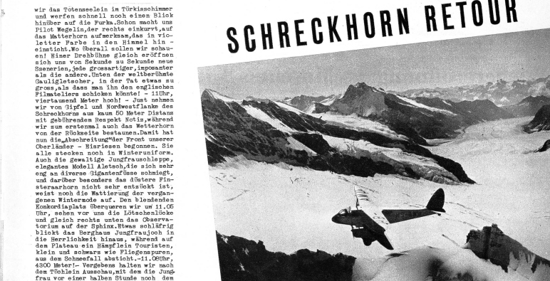
Blick auf den Aletschgletscher und die Sphinx (Vordergrund)

lassen und schmerzende auf den Wiesen himelstern. Längs hoch uns wieder der Thunersee entgegen, den wir während einer engen Kurve Über dem Hensendöfel als rötlichen Kreiselung irgendwo in Nichte hängen sehen. — 11.35 Uhr — Nun befindet unsere treue Maschine an seinen, liest sich wie ein Hühner durchfliegen auf der tierblauen Himmelskugel, Stossempfänger, Amoldigersee kommen und über, in Westen grüsst das Guggerbühl. Schon sehen wir vor uns die Bundesstadt, hoch gleich kurven wir ab und um 11.40 Uhr nimmt uns die Erde wieder in Empfang, machen wir uns über unbeschreibliche Jochsprucht, die sie schonbar nur aus Schweizern und Bernern in sich verschwindender Pille resorbiert hat, in vollsten Sätzen gelassen dürfen. Pünktlich ist unten Alpenflug, Abstecher in eine saubere Traumwelt, in die wir uns gerne noch dutzendmal, hundertmal entführen lassen möchten.