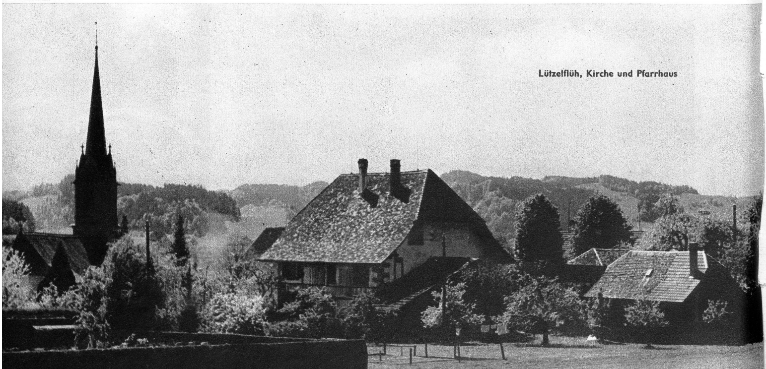
Lützelflüh, Kirche und Pfarrhaus