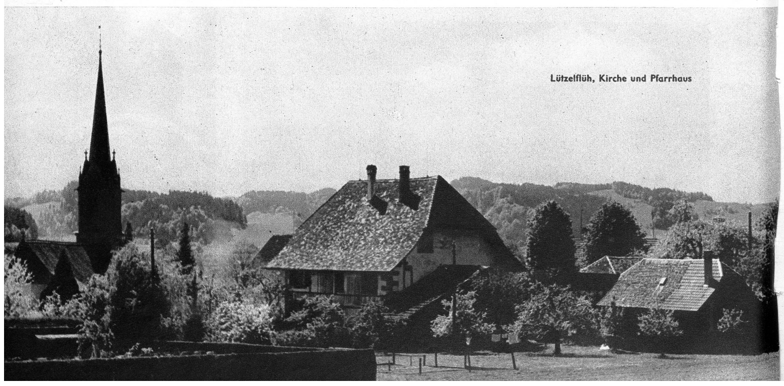
Lützelflüh, Kirche und Pfarrhaus