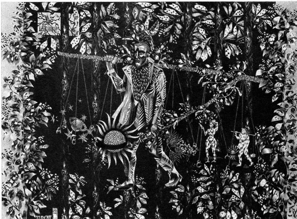
«Der Mensch», nach Entwurf von Jean Lurçat, ausgeführt im Atelier Jansen in Aubusson.