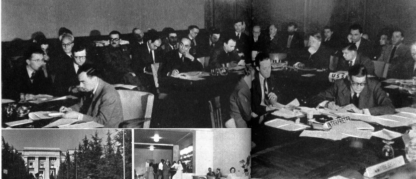
Eine Sitzung der Balkanuntersuchungskommission. In diesem Saal wurde mancher harte Strouss ausgefochten.

scheint die Kräfte der kleinen Stadtrepublik zu übersteigen. Aber wiederum tragen die Kurzwellen den Namen Genfs und damit der Schweiz in alle Teile der Welt. Darf Genf, hat Genf das Recht, müde zu werden? Sein Prestige ist auch das Prestige der Schweiz. Wenn irgendwo, so sollte sich das Schweizer Volk erinnern, dass es doch die legendäre Devise gibt: simul für alle, alle für einen . Die neue historische Mission der Schweizerstadt Genf, die „Hauptstadt Europas“ zu werden, darf nicht daran scheitern, dass die Bürgerschaft und das Schweizer Volk diese alte Wahrheit vergisst.