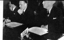
Eine Sitzung der „Europäischen Wirtschaftskommission“, welcher der Wiederaufbau der Wirtschaft Europas anvertraut worden ist. Rechts: W.L. Clayton, Unterstaatssekretär der USA, für wirtschaftliche Angelegenheiten. Links: Botschafter Zorin, Leiter der sowjetrussischen Delegation.

scheint die Kräfte der kleinen Stadtrepublik zu übersteigen. Aber wiederum tragen die Kurzwellen den Namen Genfs und damit der Schweiz in alle Teile der Welt. Darf Genf, hat Genf das Recht, müde zu werden? Sein Prestige ist auch das Prestige der Schweiz. Wenn irgendwo, so sollte sich das Schweizer Volk erinnern, dass es doch die legendäre Devise gibt: simul für alle, alle für einen . Die neue historische Mission der Schweizerstadt Genf, die „Hauptstadt Europas“ zu werden, darf nicht daran scheitern, dass die Bürgerschaft und das Schweizer Volk diese alte Wahrheit vergisst.