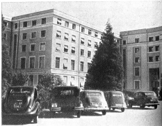
In Hof des UNO-Palastes: Autos aller Herren Länder reihen sich aneinander.