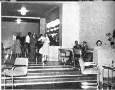
Die Bor des UNO-Palastes