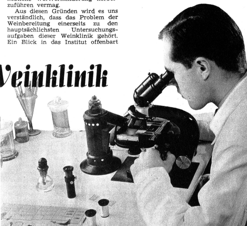
Oberes Bild: Zur Ermittlung des Alkoholgehaltes wird der Wein destilliert. – Oben: Eine Kollektion ausgewählter Hefesorten zur Weinbewertung. – Links: Die Weinprobe. Im Schüttelglas konzentriert sich das «Bouquet» – Rechts: Untersuchung auf den Bakteriengehalt unter dem Mikroskop