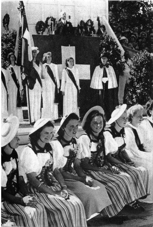
Am Montag ist das Eidgenössische Turnfest 1947 in Bern zu Ende gegangen. Es war ein glanzvoller Schluss eines glanzvollen Anlasses. Bundespräsident Philipp Etter hielt eine Ansprache, wobei er sagte: «Ihr gebt dem Lande ein dreifaches Beispiel: das Beispiel der Kraft, das Beispiel des Mutes und das Beispiel der Zusammenarbeit.» Dies war das Leitmotiv der Rede unseres höchsten Magistraten

Nr. 30 • Bern, 25. Juli 1947 • Einzelpreis 50 Rappen