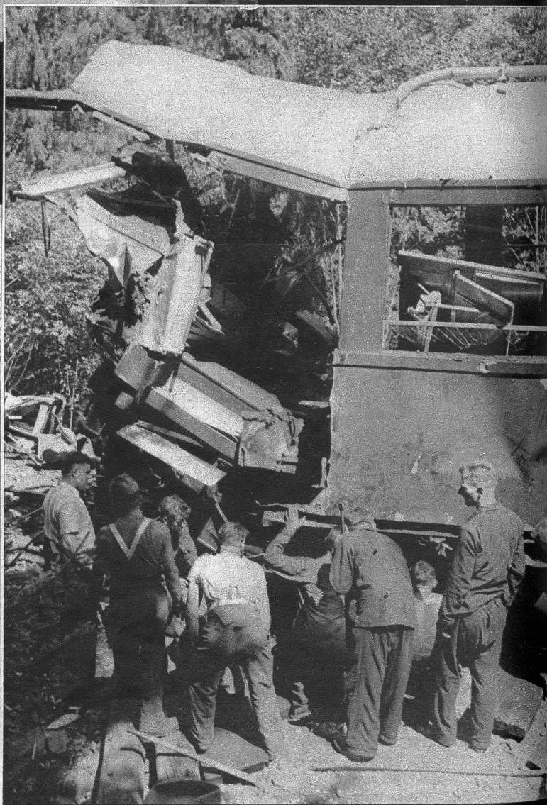
Oben: Der vollkommen eingedrückte vordere Führerstand des talwärts fahrenden Motorwagens. Der tote Wagenführer konnte erst nach stundenlangen Bemühungen mit Schweissapparaten geborgen werden. - Links: Die links und rechts des Trasses herumliegenden Wagentrümmern werden abtransportiert