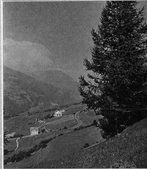
Vazerol, zur Gemeinde Brienz gehörend, ist ein kleiner Weiler mit ein paar Häusern