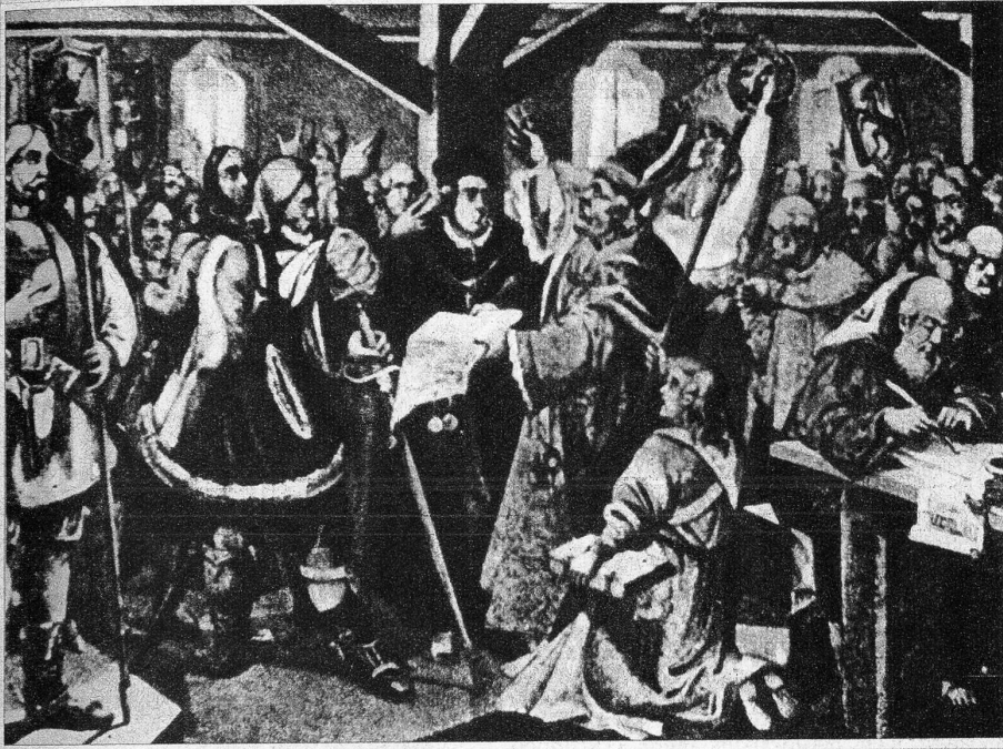
Ein Stich, der den Bund zu Vazerol zeigt. Im Jahr 1471 kamen auf dem Hof zu Vazerol sämtliche Herren geistlichen und weltlichen Standes, die Vorsteher und Boten des Volkes, der Gemeinden und des Gerichtes zusammen und schwuren die ewige Vereinigung aller Bünde und Volksteile Rätens