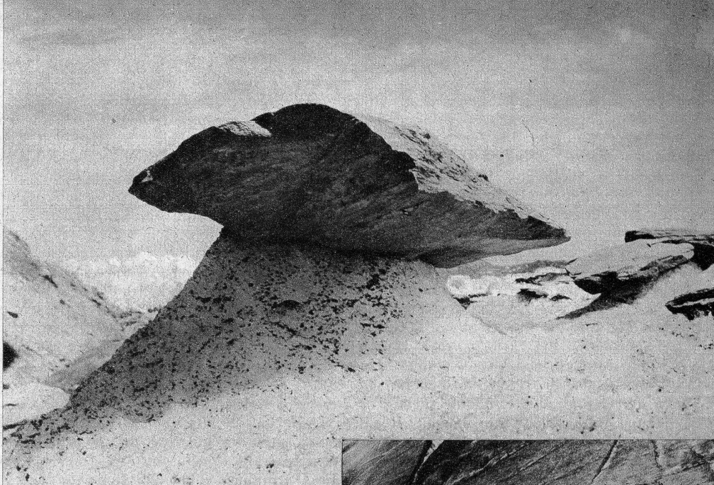
Gletschertisch auf dem grossen Aletschgletscher

Ihm fiel ein, dass sie einmal bemerkt hatte, Géran habe ihr mit dem Augenblick der Heirat das Spielen verboten. Welch grenzenloser Egoismus lag darin, ein Talent wie Sybil es besass, zu unterdrücken! Welche anmassende männliche Eitelkeit! Oder waren es sogar Minderwertigkeitsgefühle, Un-