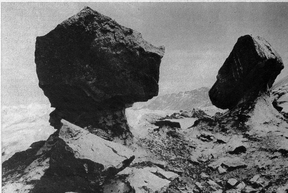
Zwei Gletscherpilze auf dem Aletschgletscher