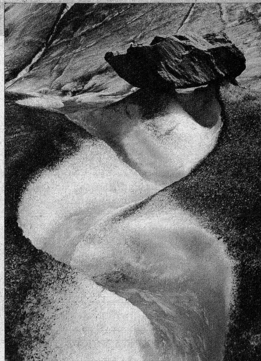
In ausgerundeten Bogen nimmt der gurgelnde Gletscherbach seinen Lauf (Aletschgletscher)

Freut euch also an diesen Wundern der Natur ohne sie zu besteigen!