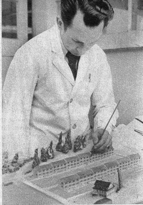
Die schwierigsten Modellbauten, die viel exakte Kleinarbeit verlangen, meistert er mit grosser Geschicklichkeit