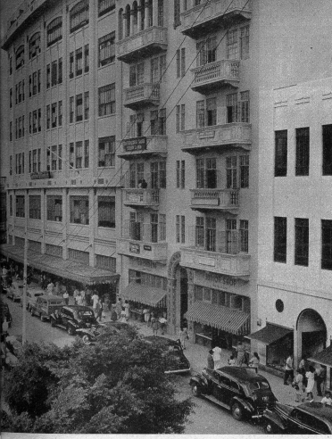
San Juan hat auch grosse Warenhäuser. Unser Bild zeigt das grösste von ihnen, das der Firma Padin gehört

Minen hat eben erst angefangen. So wird es wohl noch einige Zeit brauchen, ehe es eine richtige Demokratie mit gleichen Rechten und gleichen Löhnen in dieser amerikanischen Kolonie geben wird, so sehr auch das Mutterland zur Erziehung und zum Aufblühen des Landes mithilft. Aber es wird eben unten feine Erziehungsanstalten für die Kinder der reichen Leute geben und oben in den unzugänglichen Wäldern noch wahrscheinlich sehr lange andere Kinder, die nicht viel Gelegenheit zum Studium haben werden, dafür mehr zu harter Arbeit.