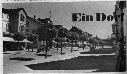
Die Hauptstrasse in Kreuzlingen, die zum Zell führt

K reuzlingen, das soeben zum Benjamin unter den Städten heranwuchs, verankert seine Gründung dem hl. Konrad I. der 943-975 Bischof von Konstanz war. Nach der Rückkehr von seiner Pilgerfahrt nach Jerusalem stiftete er im Jahre 988 in Stadelhofen, einem Vorort des damaligen Konstanz, ein Asyl für Arme, Kranke und Pilger und beschenkte dieses