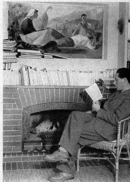
Wertvolle Originalgemälde schmücken das Bibliothekszimmer des 34jährigen Schriftstellers, der heute neben Ch. F. Ramuz zu den bekanntesten Erzählern der Westschweiz gehört

Wer den Boden des Wallis betritt, kommt in einen Kanton, der eine Eidgenossenschaft für sich bildet. Wohl hat er seit seinem Eintritt in den Bund, der im Sommer 1815 erfolgte, helvetische Züge angenommen. Aber wenige Gebiete der Schweiz wurden durch die Neuzeit so wenig abgeschliffen und schablonisiert wie das Wallis, von dessen Bodenfläche beinahe die Hälfte unfruchtbar ist. Das bedingt ein hartes, arbeitsames Leben, eine herbe Rasse, die nicht nur den feurigen Fendant trinkt, sondern auch trockenes, monatealtes Brot und selbstgemachten Käse isst. Es ist überhaupt ein Land ungeheurer Gegensätze. In der Höhe die buckligen Gletscher, die wie Schildkröten in der Einsamkeit brüten, in der Tiefe die junge Rhone, die wie ein junger, feurriger Stier in die Arme des Genfersees galop-