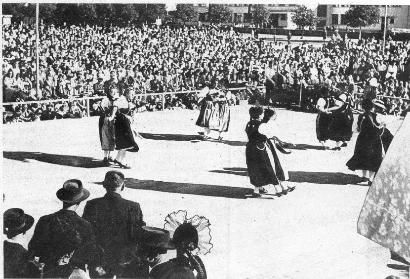
Die Trachtengruppe Lenk tanzt einen «Fyrabewalzer»

Wo könnte sich das Bekanntnis zum Le- ben, zur Freude und zur Heimat besser offenbaren als im Volkstanz?