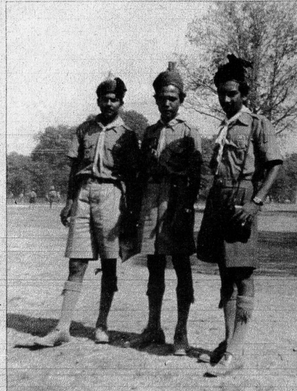
Drei Pfader der indischen Delegation. Alle Klassenunterschiede sind verschwunden

Amitié des Jeunes - Paix des Hommes! ME II