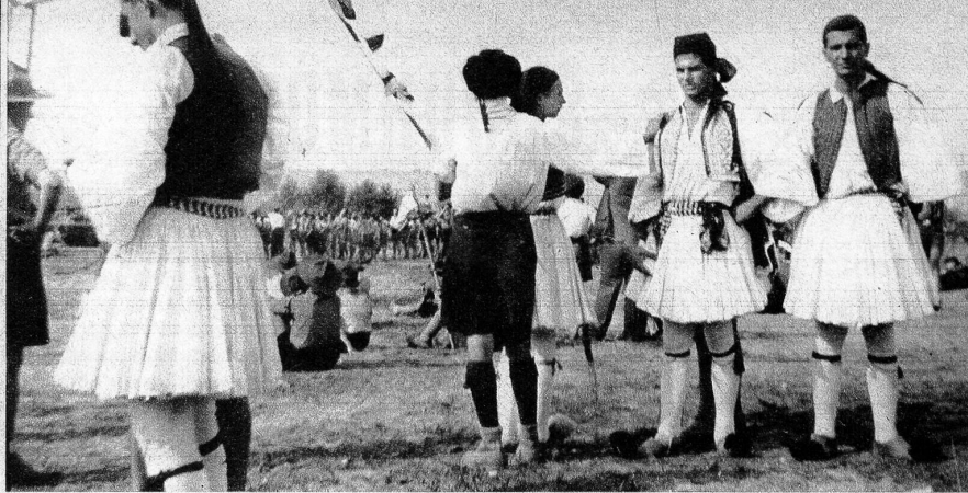
Griechen auf dem Lagerplatz in Moisson