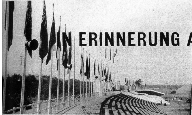
Die Tribüne, geschmückt mit den Landesfarben aller anwesenden Nationen