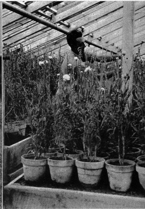
Erst wenn die Pflanze ein gewisses Alter erreicht hat und wenn das Wetter kalt und unfreundlich wird, kommt sie unter das schützende Glasdach

scheinlich auch den französischen Namen führt. In späteren Jahren kam diese Blume nach England und gelangte dann auf irgendwelchem, heute nicht mehr feststellbarem Wege in die Schweiz. Die Malmaison-Nelke soll im Jahre 1896 erstmals im Dörfchen Lü, weit oben an der linken Flanke des obern Münstertals, aufgetaucht sein, von wo sie nach Santa Maria hinuntergebracht und seither weitergezüchtet wird. Es entspricht aber nicht nur einer Zufälligkeit, dass diese Nelke in einem der bündnerischen Südtäler gedeiht, denn ausschlaggebend für eine solche Nelkenzucht bleibt neben dem Boden vor allem das Klima. Das 1388 m über Meer gelegene Santa Ma-