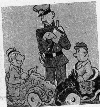
Polizist: «Warum lachen Sie?» - Fahrer: «Ueber den Herrn, der mich anfuhr, er ist nämlich der Direktor meiner Versicherung»