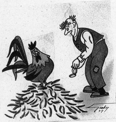
«Nennst du das halb fünf Uhr?»