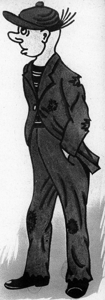
Vorsichtig. «Zwanzig Franken konnte ich mir stehlen! Gesehen hat mich niemand - jetzt heisst es nur, nicht zu nobel auftreten!» (Graber)