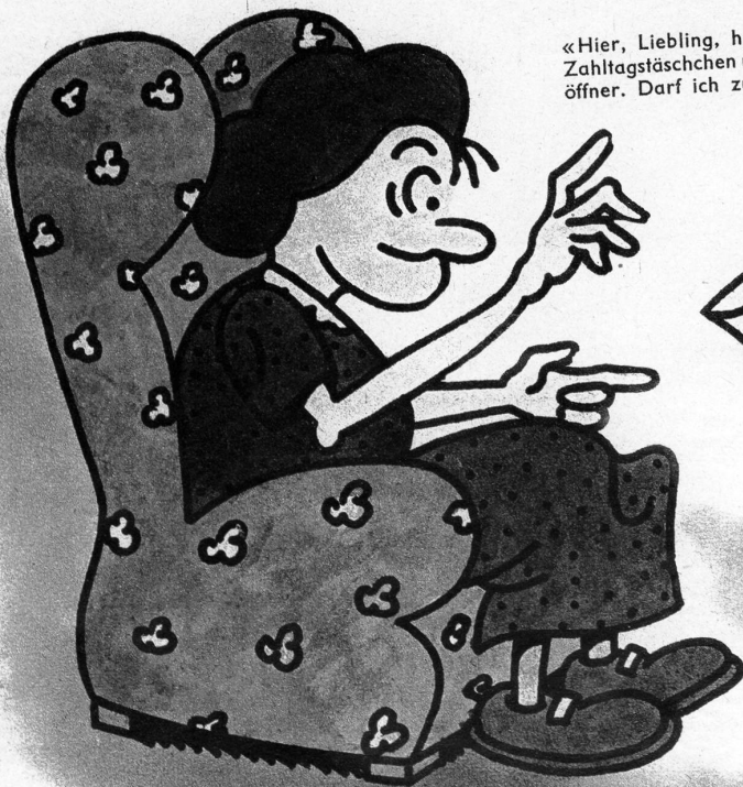
«Hier, Liebling, habe ich mein Zahltagstäschchen und den Brieföffner. Darf ich zusehen?»