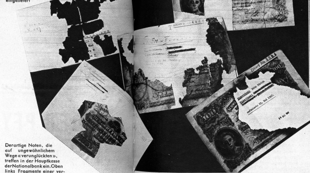
Derartige Noten, die auf ungewöhnlichem Wege erworbenen, treffen in der Hauptkasse der Nationalbank ein. Oben links Fragmente einer verkohlten Hunderternote. Die Fünftzennernote in der Mitte stellt ein verhältnismässig gut erhaltenes Stück eines vermoderten Papiergeldstückes dar