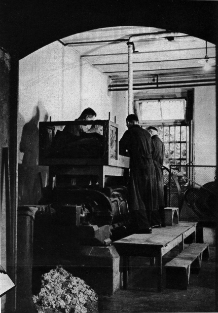
Hier hauchen die abgeschrieben Banknoten ihr Leben aus. Die Zerfasermaschine in der Eidgenössischen Münz an der Arbeit