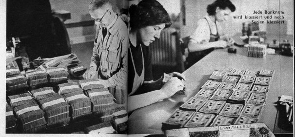
Jede Banknote wird klassiert und nach Serien klassiert