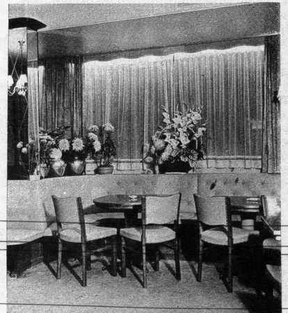
Die Fensterbank im grünen Salon ladet zum Verweilen ein

So zeigt der Tea Room Wölfl heute alle Vorzüge einer modernen und gepflegten Gaststätte und kann in seiner ganzen Art und Form als ein kleines Werk des Meisters angesprochen werden, gerade weil die kluge Erfüllung des Zweckes im Raum dem Ganzen zur Voraussetzung diente.