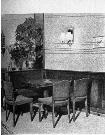
Eine gemütliche Ecke im roten Salon.

Rechts: Der Raum auf der Strassenseite wirkt elegant und gediegen