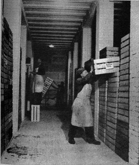
Künstlich ventilierter Obst-Lagerkeller für 120 Tonnen

Stützt auf die gemachten Erfahrungen wurde der anfängliche Lagerschuppen in Zollikofen unterkellert, sukzessive erweitert und die Einrichtungen ausgebaut. Damit wurde ein Stützpunkt geschaffen, um den Genossenschaften in der Abnahme von Obst bessere Dienste leisten zu können. Andererseits musste aber auch Raum geschaffen werden für das mit der zunehmenden Tätigkeit in der Verwertung landwirtschaftlicher Produkte zusammenhängende, nötige, umfangreiche Emballagematerial wie