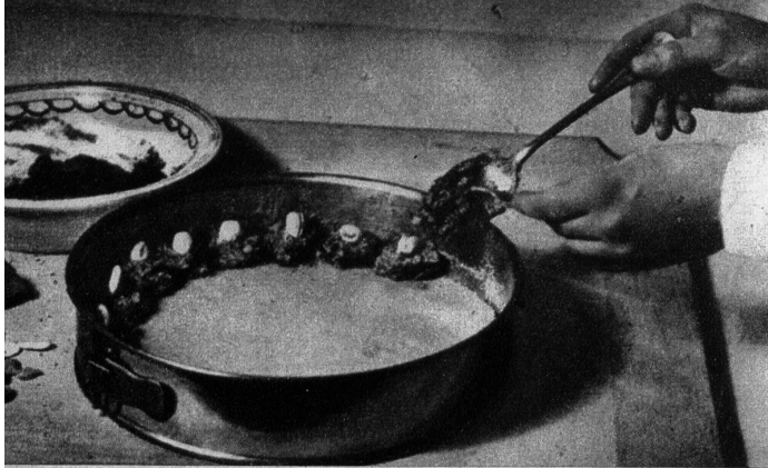
Die Festtagstorte bekommt einen Rand aus Makronenmasse