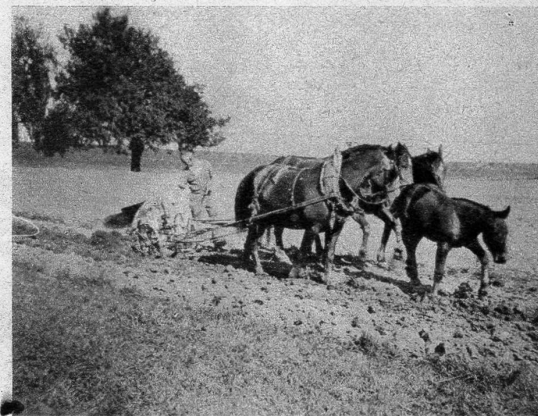
Ein währschafter Cossonay-Berner pflügt eigenen Boden auf einer Anhöhe über dem alten Städtchen

seine führende Rolle für immer ausgespielt. Heute ist Cossonay noch Hauptort des gleichnamigen Bezirks mit Regierungsstatthalteramt und andern Verwaltungsbehörden. Zudem ist das Städtchen für die vielen umliegenden Dörfer dem Jurahang nach der beliebte Marktplatz. Cossonay ist auch Kreuzungspunkt der grossen Ueberlandstrassen der Waadt. Milchwirtschaft und Ackerbau sind Cossonays Haupteinnahmequellen. Rings um Cossonay herum haben sich viele Berner Bauern grosse Stücke des überaus ertragreichen Landes angeeignet und pflegen es mit echt bernischer Ausdauer. Nicht umsonst hat mir einer dieser Cossonay-Berner die bedeutenden Worte zugeflüstert: «Einst haben unsere Vorfahren diesen herrlichen Boden mit Gewalt eingenommen, mit Eisen und Stahl gehalten und dennoch alles verloren; wir nehmen dasselbe Erdreich im Frieden ein, bearbeiten es mit unserem Werkzeug und unserer Kraft — und langsam kommt das verlorene Gold wieder zum Vorschein.» — Wer in Cossonay lebt, braucht nicht zu darben: der Boden ist reich, das Volk arbeitet und der Segen wird spürbar. K. Chr.