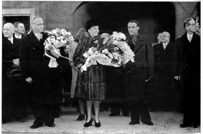
Rechts: Im ganzen Welschland, besonders aber im Kanton Waadt und in Lausanne herrscht eitel Freude darüber, dass ein engerer Landsmann in die höchste Behörde der Eidgenossenschaft gewählt wurde. Dem entsprach auch der Empfang, den die Stadt am Léman dem neuen Bundesrat bereitete. Wir zeigen von links nach rechts Bundesrat Rodolphe Rubattel, seine Gattin, Bundesrat Petitpierre und, weiter in der vordersten Reihe, Nationalratspräsidenten 1948, Picot.