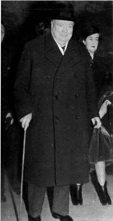
Winston Churchill, der Führer der englischen Opposition, hat Grossbritannien verlassen, um sich nach Marokko zu begeben, wo er die Weihnachtsfeiertage in Marrakesch zu verbringen gedenkt. Unser Bild zeigt die Ankunft «Winnie» Churchills in Paris.