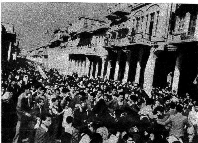
Auch in Bagdad (Irak) hat die Teilung Palästinas nicht eitel Freude hervorgerufen. Im Gegenteil: eine Riesenmenge, unter denen sich unzählige Schüler von jungen Jahren befanden, die sich teilweise kaum über die Tragweite ihres Tuns klar waren, stürmten den Informationsdienst der Vereinigten Staaten und schlugen kurz und klein, was ihnen in die Hände kam.