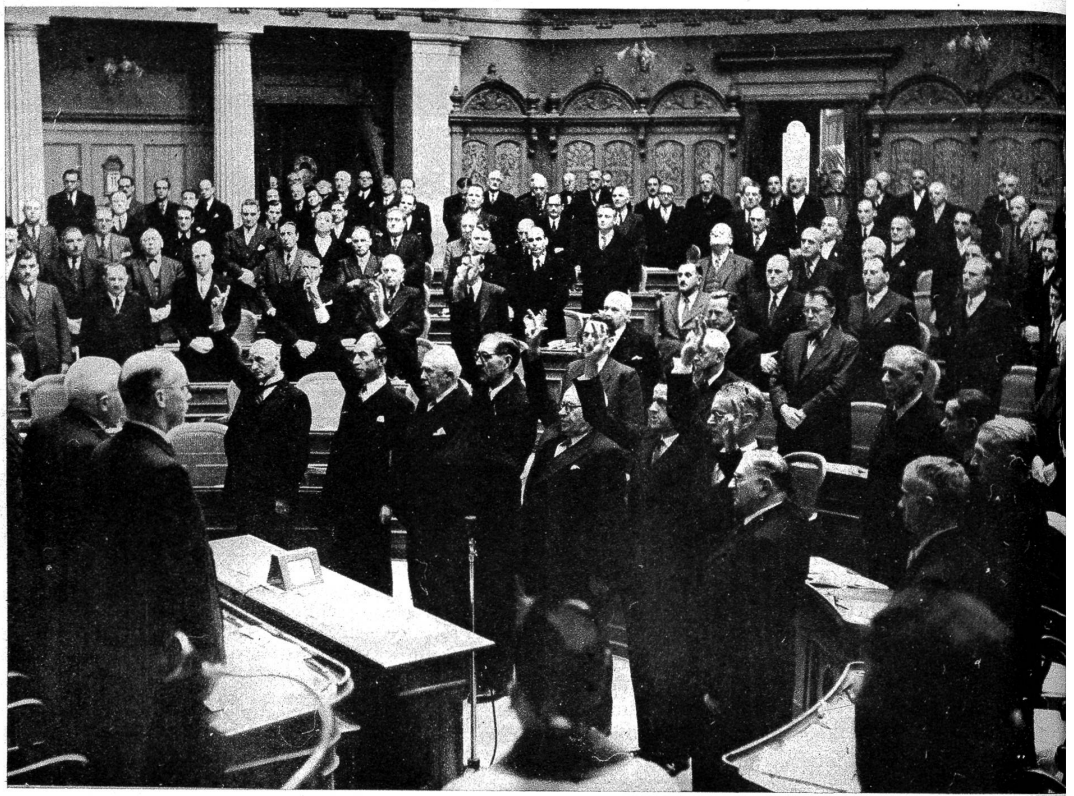
Oben: In der vergangenen Woche, am 11. Dezember, wurden von der Bundesversammlung die Bundesräte neu gewählt und vereidigt. Unser Bild zeigt die Bundesräte und den Bundeskanzler mit erhobener Hand bei Ablegung des Eides.