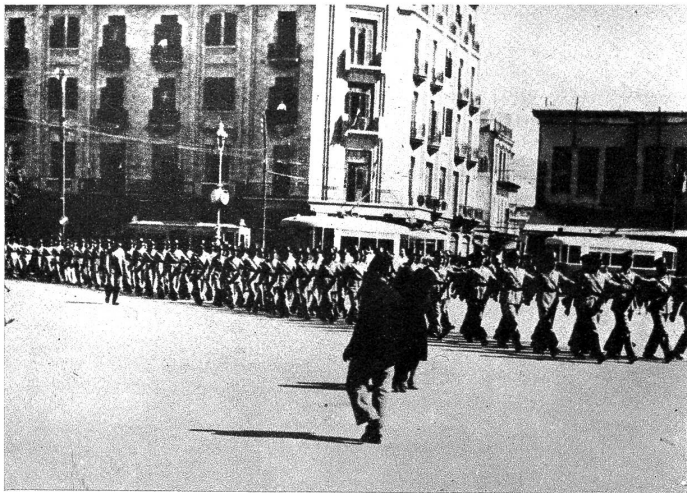
Im Zusammenhang mit dem «Heiligen Krieg», der in Palästina wütet, liess die syrische Regierung in Damaskus die Generalmobilmachung bekanntgeben. Unser Bild zeigt eine Parade der einberufenen Truppen in Damaskus. ATP.