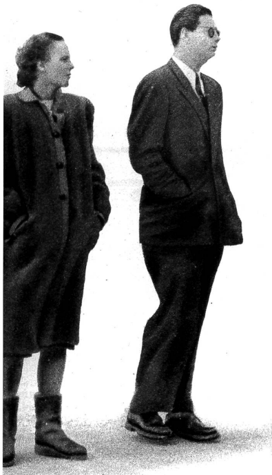
Um König Michael und Anne von Bourbon gehen interessante Gerüchte durch die Welt, die von einer Verlobung der beiden sprechen. Prinzessin Anna aber hat ausdrücklich erklärt, sie wisse nichts von einer Verlobung — und doch trifft man sie immer wieder mit König Michael. Unser Bild zeigt das Paar auf dem Genfer Flugplatz.