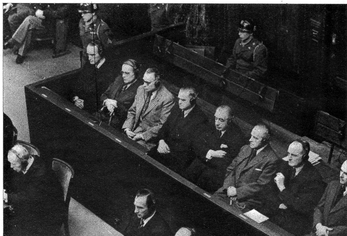
Auf der berühmten Nürnberger Anklagebank, wo die grossen deutschen Kriegsversbrecher abgeurteilt wurden, haben 12 Direktoren der Krupp-Werke Platz genommen, um von einem amerikanischen Militärgericht für ihre unmittelbare Beeinflussung des deutschen Krieges verurteilt zu werden. Auf der Bank von links nach rechts: Alfred Krupp, von Bohlen, Halbach, die drei Hauptangeklagten des Prozesses.