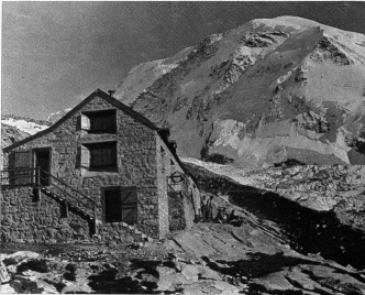
Bötsenshütte und Lyskamm