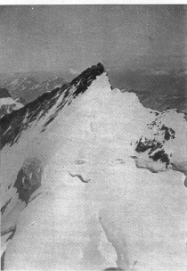
Nordend von der Dufourspitze aus gesehen

sten Male die Säcke ab und setzten uns zum Schauen und auch zum Essen in den Schnee. Wenn irgendwo in den Schweizer Alpen der Eindruck des Hochgebirges ein vollkommener ist, dann in den weiten Gletschern des Monterosamassivs. Ringsum Eis und Schnee und Schnee und Eis und nur nach Norden hin öffnet sich die Sicht auf die Zermatter Berge.