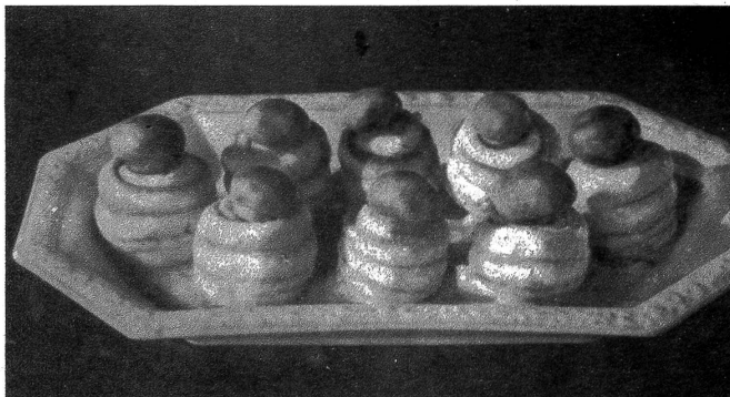
Fischfilets mit Champignons

das Blauwerden verursacht, nicht abgenommen wird. Dann werden sie gewaschen und mit Essig übergossen und zugedeckt eine halbe Stunde stehen gelassen, wodurch sie blau werden. Dann gibt man die Forellen in kochendes Salzwasser mit etwas Essig und lässt sie 6 bis 12 Minuten auf kleiner Flamme ziehen. Dann werden sie sorgfältig herausgehoben und auf einer Platte hübsch angerichtet. Dazu serviert man ausgelassene frische Butter (so man hat) oder eine holländische Sauce und Salzkartoffeln.