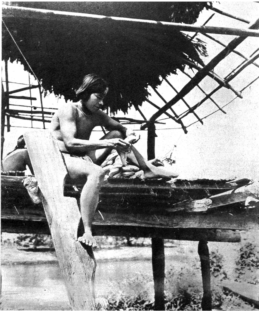
Wie bei uns zur Pfahlbauzeit! Choco-Indianer in seiner primitiven Hütte