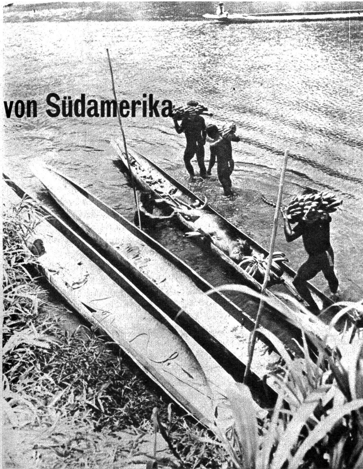
Ihre 18 Meter langen schmalen Boote sind meist aus Mahagoni-Holz zugeschnitten