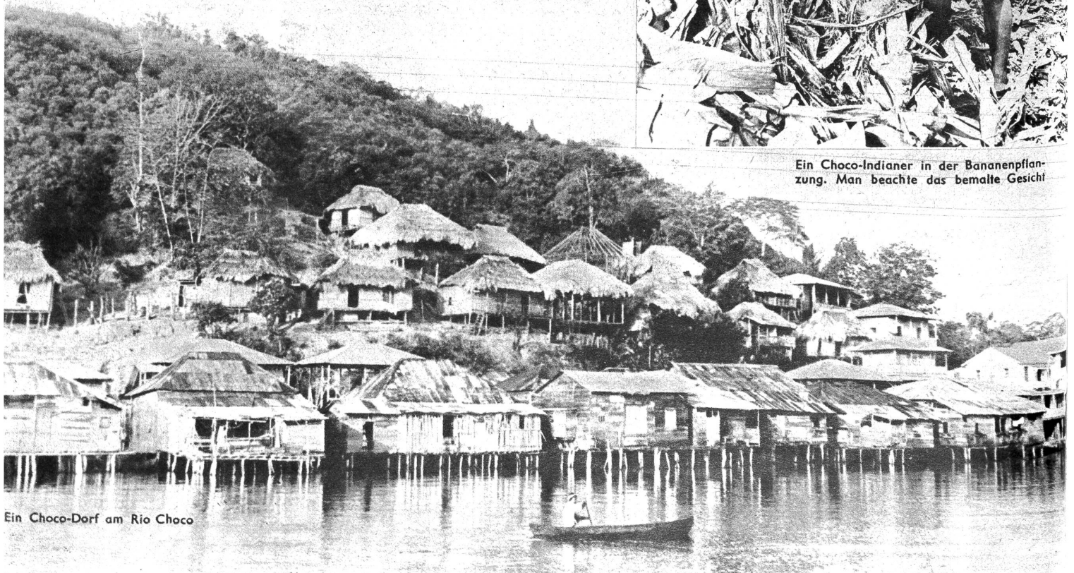
Ein Choco-Dorf am Rio Choco