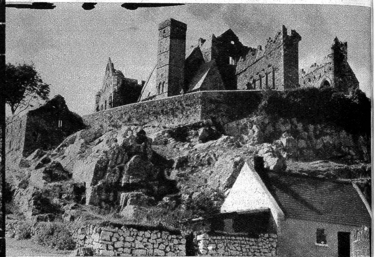
Der berühmte «Felsen» von Cashal in der Grafschaft Tipperary, oft als Akropolis Irlands bezeichnet, spielte in der irischen Geschichte stets eine grosse Rolle