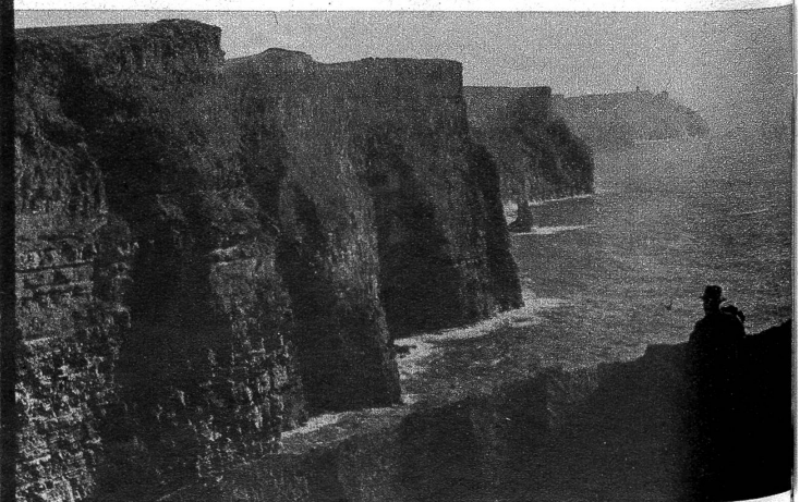
Die wilden Klippen von Moher trotzen den Wogen des Atlantischen Ozeans gleich Wällen einer Zyklopen-Festung