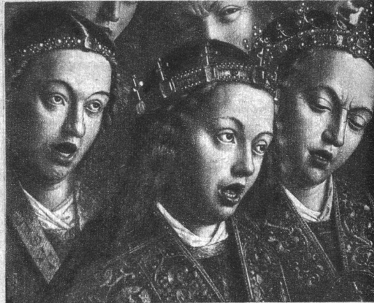
Zu beiden Seiten der himmlischen Dreiheit (Gottvater, Maria und Johannes der Täufer) stimmen musizierende Engel ein Loblied zum Preise des Höchsten an

Der Obersenn von Staffalp - es war der Alte mit dem ungeheuerlichen, weisen Haarschopf, der abends vorher in der oberen Hütte von Gletschersagen berichtet hatte - legte die Hand über die Augen und spähte nach dem niedersteigenden Menschen. Dieser ging etwas mühsam und wie unter einer schweren Last gebeugt langsam das Geröll hinab. Der Senn glaubte zuerst, es sei der fremde Herr, der abends bei dem Dorfe auf der verlassenen Hütte zugegen gewesen war. Dann aber entsann er sich, dass dieser braun gekleidet gewesen war, jener da oben aber schwarz und schattenhaft über das Geröll ging. Auch gab es von dort keinerlei Pfad nach der obersten Hütte, es gab überhaupt keinen Weg, den jener beschreiten konnte. Denn oberhalb des Geröllfeldes setzten wild und ungangbar die Wände des Schneewinkelhornes an. Und auf diesem gab es keine Menschen; sondern nur böse Geister und allerlei nächtliches Hudelvolk, die den Samen um Mitternacht die Kühe ausmelken, die Steine von den Dächern wälzen und sonst wüst tun. Der Senn betrachtete also den Näherkommenden misstrauisch und schlug für alle Fälle ein Kreuz, denn man konnte nicht wissen, wozu das gut sei.