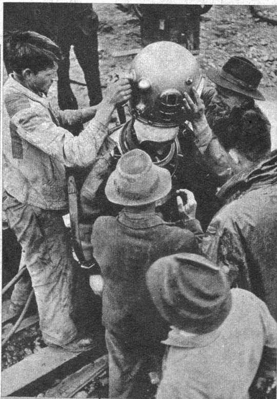
Links: Der Helm wird aufgeschraubt – der Taucher kann in die Erde steigen. Rechts: Mit der Seilwinde wird der Taucher in die Regionen der unterirdischen Gewässer hinabgelassen. Die Arbeit ist nicht ganz ungefährlich, da der Taucher leicht zerquetscht werden kann, wenn die stählerne Einstiegsöffnung des Caissons ins Pendeln gerät. Die Arbeitskameraden und der Bauingenieur sind daher jedesmal recht froh, wenn sie den Mann wieder an die Oberfläche ziehen können

Kräftige und gesunde Männer sind für die Arbeit in den Caissons nötig und einer von ihnen ist nun in den Taucheranzug gestiegen