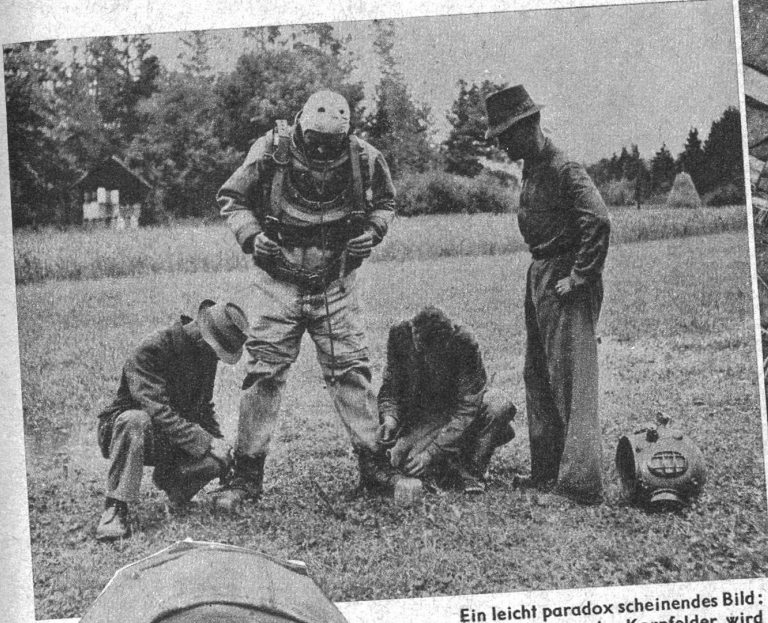
Ein leicht paradox scheinendes Bild: Inmitten wogender Kornfelder wird dem Taucher die Ausrüstung angezogen.