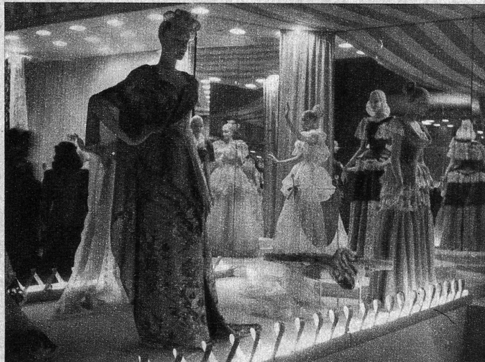
Unter den Spitzenprodukten ist es die einheimische Textilindustrie, welche hervorragende Leistungen zeigt. Duftige Stoffe, verarbeitet zu wundervollen Kleidern, die die Sehnsucht jeder Frau sein müssen, geben im Verein mit einer übersichtlichen Anordnung Zeugnis von einem nicht zu überbietenden Standard der schweizerischen Textilindustrie

Unten: Mit imponierenden Erzeugnissen wartet in der Halle «Elektrizität und Kraftmaschinen» die einheimische Präzisionsindustrie auf. Mächtig bestaunt wird die im Vordergrund sichtbare Zweitakt-Diesel-Schiffsmaschine von 840 PS, hergestellt von Sulzer, Winterthur (ATP)