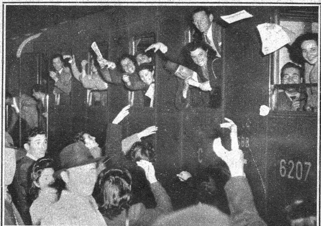
60 000 Italiener aus der Schweiz fahren zur Stimmabgabe in ihre Heimat. In 18 Extrazügen in der Nacht vom 16./17. April haben die SBB diesen Strom reibungslos bewältigt. (ATP)