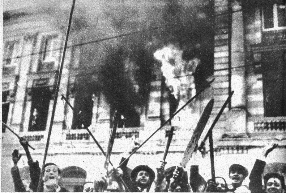
Der Aufruhr in Bogotä. Von der Wildheit, mit der die Columbianer ihren Aufstand in der Hauptstadt, in der gerade die Panamerikanische Konferenz tagte, durchführte, zeugt diese Szene vor einem in Brand gesteckten Regierungsgebäude, das den Flammen gänzlich zum Opfer fiel. Die Männer schwingen Macheten (Urwaldmesser), Peitschen, Stöcke und Fackeln und freuen sich der von ihnen angerichteten Verwüstung.