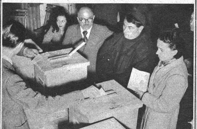
Italiens Schicksalsstunde! Blick in ein Mailänder Stimmlokal während des Urnenganges am Sonntag. Auf einem Tisch sind die hölzernen Wahlurnen aufgestellt, hinter denen die Vertreter der zu den Wahlen zugelassenen Parteien Aufstellung genommen hatten. Hier erfolgt soeben die Stimmabgabe durch eine Frau, einen Geistlichen und einen Beamten.