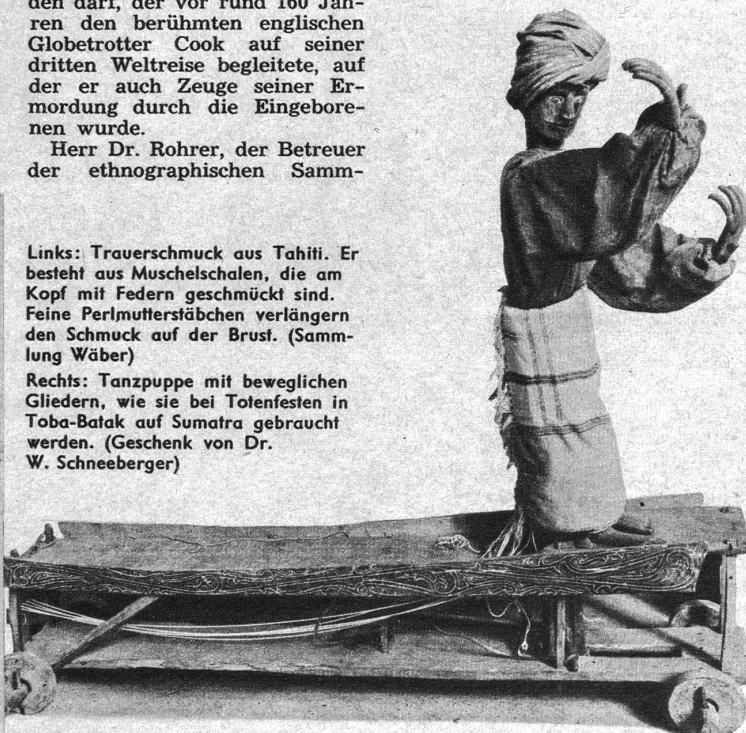
Rechts: Tanzpuppe mit beweglichen Gliedern, wie sie bei Totenfesten in Toba-Batak auf Sumatra gebraucht werden. (Geschenk von Dr. W. Schneeberger)